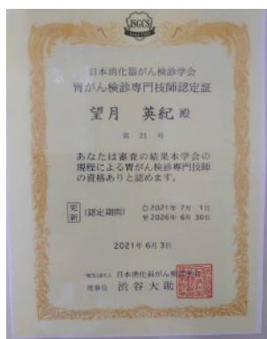
胃がん検診専門技師 認定証

また、胃部X線検査では、 日本消化器がん検診学会 より認定を受けた、『胃がん検診専門技師』、『胃X線検診読影補助認定技師』が撮影を行っております。検診先を検討される際には、是非ご参考になさってください。