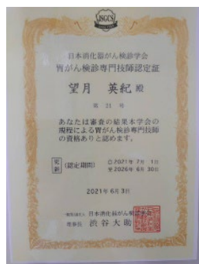
胃X線読影補助技師 認定証